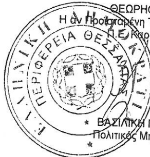
* ΒΑΣΙΛΙΚΗ ΠΕΤΣΙΑ Πολιτικός Μηχανικός

ΘΕΩΡΗΘΗΚΕ Η αν. Προϊστάμενη Τεχνικών Έργων Καρδίτσας