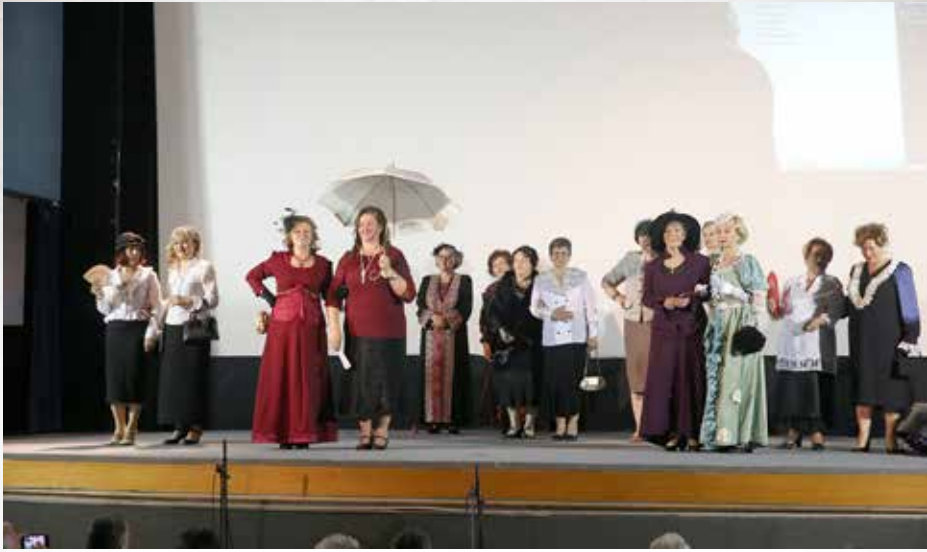
Από την εμφάνιση του χορευτικού τμήματος του Κέντρου Ιστορικής και Λαογραφικής Έρευνας «Ο ΑΠΟΛΛΩΝ» Καρδίτσας στις ετήσιες εκδηλώσεις «ΜΕΡΕΣ ΠΑΡΑΔΟΣΗΣ 2018» που παρουσίασε αστικούς χορούς και τραγούδια της Σμύρνης και των παραλίων της Μ. Ασίας.