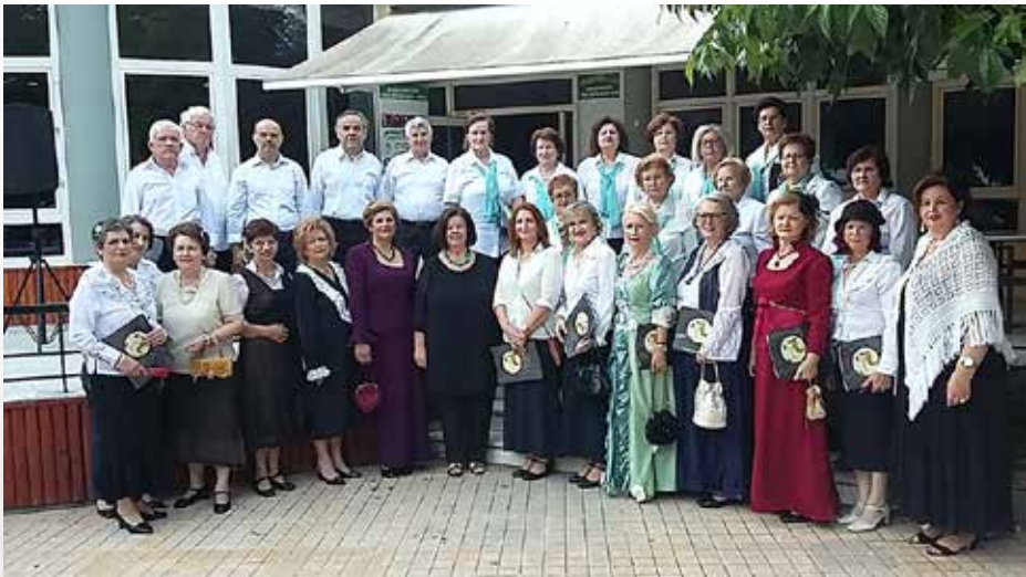
Από την εμφάνιση της Χορωδίας Παραδοσιακής Μουσικής του Κέντρου Ιστορικής και Λαογραφικής Έρευνας «Ο ΑΠΟΛΛΩΝ» Καρδίτσας στα Καραϊσκάκεια 2018 που παρουσίασε τραγούδια της Σμύρνης.

*Στο εξώφυλλο εικονίζεται η καρδιτσιώτικη ορχήστρα του Γιώργου Χατζηευθυμίου, το 1920 περίπου.