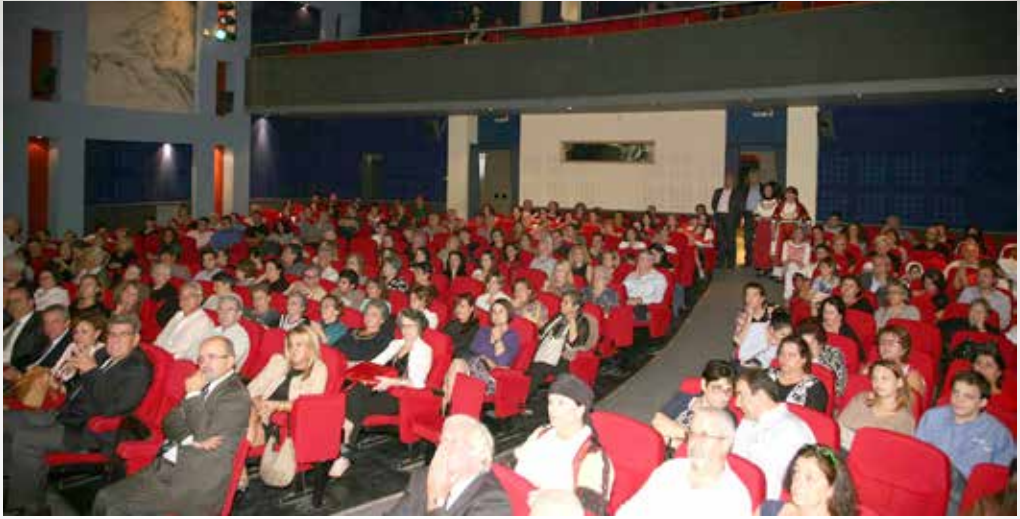
Σύνεδροι του 5ου Πανελληνίου Συνεδρίου με θέμα «Δημοτικό τραγούδι και ιστορία» (2015).